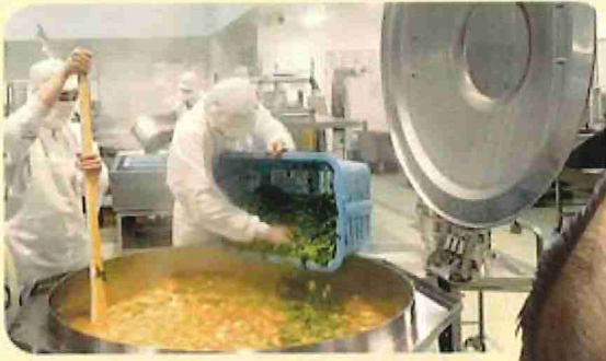
センター方式でオーガニック野菜を使う武蔵野市