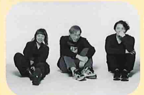
エンディングテーマ クラムボン