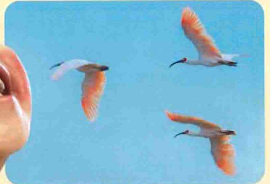
JA佐渡はトキ繁殖を願いネオニコ系農薬の販売を中止