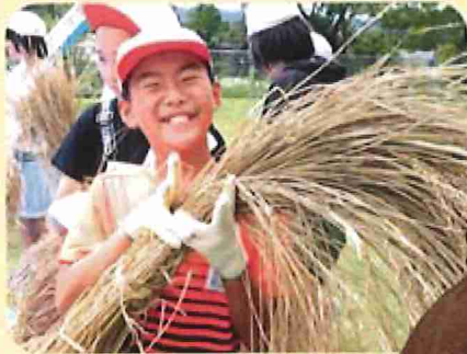
ゼロからオーガニック給食を実現させた いすみ市