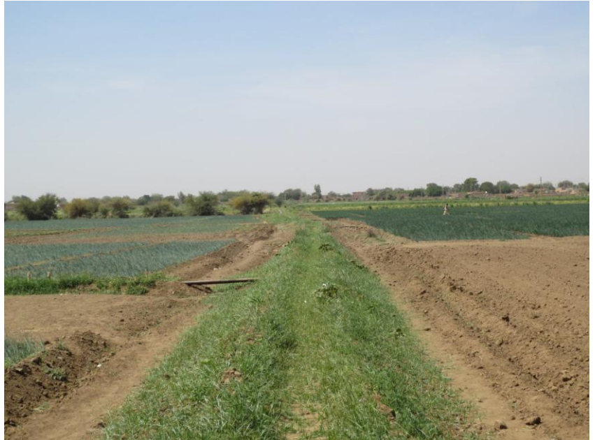
写真は塩類集積土壌における栽培試験。EM 堆肥と活性液を使用することで顕著な効果が見られた。特にタマネギ栽培において EM 区は化学肥料区の2倍の収量を得た(写真左)。

5月21日付、農業共済新聞四国版にて、ジュースの搾りかすを EM で有効利用する取り組みが紹介されました。